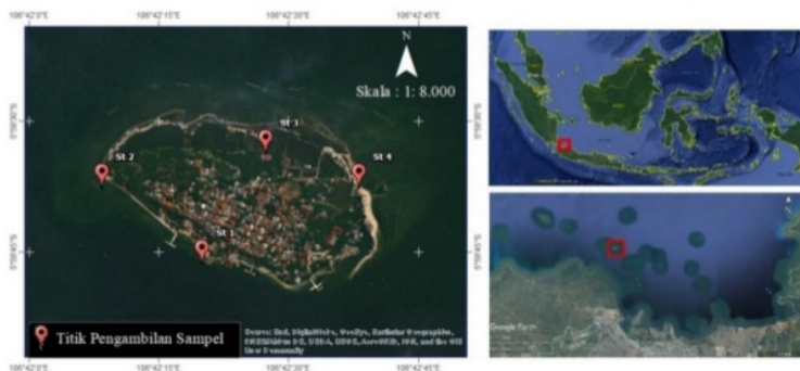
Gambar 1 Peta stasiun pengambilan sampel di Pulau Untung Jawa.

Sampel air dan sedimen diambil dari perairan Pulau Untung Jawa. Parameter kualitas air yang diukur adalah salinitas, suhu, DO, dan pH secara in-situ . Pengambilan sampel dilaksanakan pada bulan November 2019. Penelitian ini dilakukan pada empat stasiun yang dipilih secara purposive sampling , yakni teknik pengambilan sampel dengan menentukan kriteria-kriteria tertentu (Sugiyono, 2008). Metode ini dipilih agar dapat mewakili kondisi Pulau Untung Jawa. Tiap stasiun memiliki karakteristik yang berbeda yakni St 1 sebagai pantai wisata, St 2 sebagai daerah wisata snorkeling , St 3 sebagai daerah tanaman mangrove, dan St 4 sebagai tempat reklamasi pantai dan tempat perbaikan kapal (Gambar 1). Pada St 4, terdapat pekerjaan reklamasi pantai yang dilakukan dengan alat keruk hisap (Gambar 2).