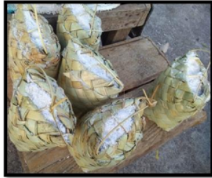
Gambar 3 Pengemasan garam lokal yang di jual di pasar tradisional

mendapatkan garam untuk memenuhi kebutuhan sehari-harinya. Setiap kemasan yang dijual tidak disertakan berapa jumlah gram garam yang dijual dengan harga Rp 10.000,00 tersebut.