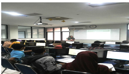
Gambar 2. Pemaparan materi blog oleh instruktur pelatihan

Materi selanjutnya akan membahas tentang cara membuat akun email Gmail, antara lain: membuat user name atau email yang mudah ingat, membuat password yang aman, step by step membuat email Gmail, pemanfaatan google drive serta cara berbagi file melalui google drive . Pada sesi kedua terlihat pada Gambar 2, materi yang akan dibahas adalah cara pembuatan blog dengan menggunakan wordpress, materi yang diajarkan antara lain: teori wordpress, syarat membuat blog, cara mendaftarkan akun di wordpress, memulai wordpress, memilih themes, cara memposting informasi didalam blog, menambahkan widget dan memodifikasi blog.