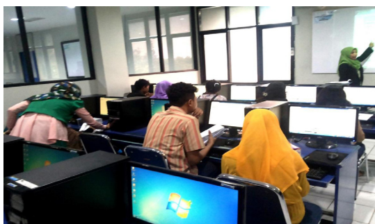
Gambar 1. Pemaparan materi pengenalan

Pada sesi pertama terlihat pada Gambar 1, asisten instruktur akan menjelaskan tentang: pengertian internet, sejarah perkembangan internet, perangkat yang digunakan untuk mengakses internet, ragam informasi yang diperoleh dari internet serta kelebihan dan kekurangan yang diperoleh dari internet.