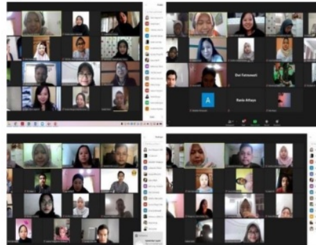
Gambar 2. Kolase dokumentasi kegiatan rapat persiapan pelaksanaan pengabdian kepada masyarakat secara daring.

melaksanakan beberapa kali rapat tim pelaksana PKM secara daring, maka diputuskanlah bahwa pelaksanaan kegiatan penyuluhan dilaksanakan secara daring dengan mengundang tiga narasumber yang dirasa memiliki kompetensi untuk memaparkan materi mengenai teknologi pengolahan limbah peternakan dan pengenalan rumput untuk dijadikan hijauan bagi ternak ruminansia.