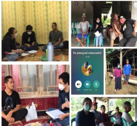
Gambar 1. Kolase dokumentasi proses wawancara dan pemetaan kelompok ternak baik secara daring maupun luring.

Berdasarkan hasil wawancara kepada para perwakilan kelompok peternak, diperoleh beberapa permasalahan yang terjadi di kelompok peternak, yakni permasalahan dalam pengadaan hijauan pakan yang berkualitas dan berkelanjutan, masalah kesehatan ternak, dan