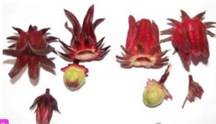
Gambar 2. Buah dan kelopak bunga rosella (Setyo-budi, 2017).