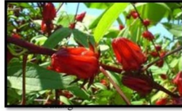
Gambar 3. Bunga rosela (Setyo-budi, 2017).