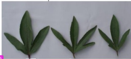
Gambar 1. Daun Tanaman Rosela (Setyo-budi, 2017).

Rosella adalah tanaman yang berasal dari Afrika (Daryanto, 2006). Bunga rosella ( Hibiscus sabdariffa L.) tanaman ini dikenal dengan banyak khasiat yang bermanfaat bagi manusia. Pemanfaatan bunga rosella ( Hibiscus sabdariffa L.) dipercaya memiliki aktivitas antioksidan terkait dengan kandungan fenolik di dalamnya (Pangaribuan, 2016). Namun, antosianin yang umumnya menjadi acuan pada aktivitas antioksidan. Pada kelopak bunga rosella bersifat kurang stabil dalam larutan netral atau basa, dan bahkan dalam larutan asam warnanya dapat memudar perlahan-lahan akibat terpapar cahaya (Harborne, 1973).