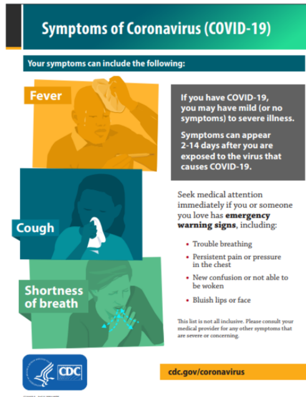
Gambar 2. Gejala COVID-19 (Centers for Disease Control and Prevention, 2020)

pasien yang hanya mengalami gejala ringan yang tidak mengalami demam (WHO, 2020).