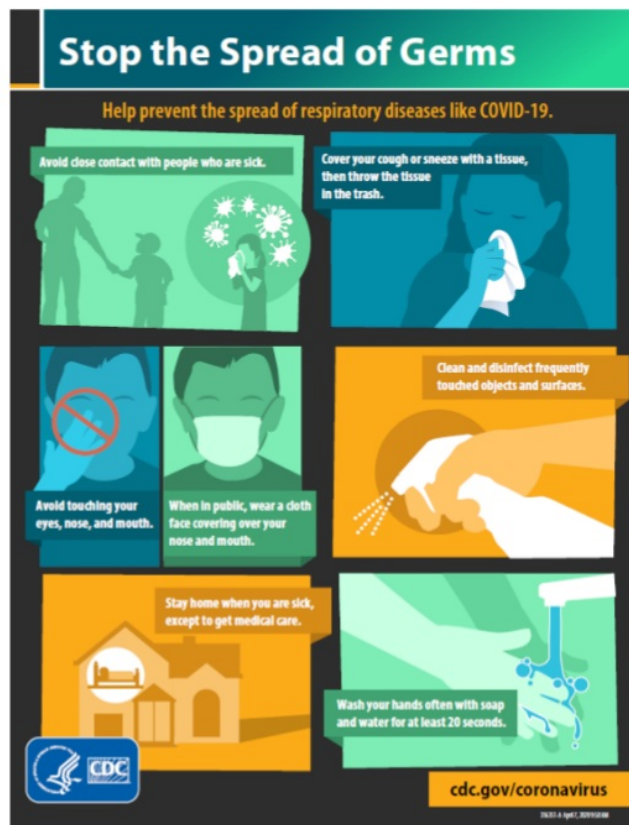
Gambar 3. Pencegahan penularan COVID-19 (Centers for Disease Control and Prevention, 2020).

Pencegahan penularan juga harus dilakukan dengan menerapkan prinsip hand hygiene , penggunaan APD saat akan berkontak langsung dengan pasien, penanganan limbah medis, pembersihan dan disinfeksi peralatan medis serta pembersihan lingkungan rumah sakit (Wang, et al., 2020).