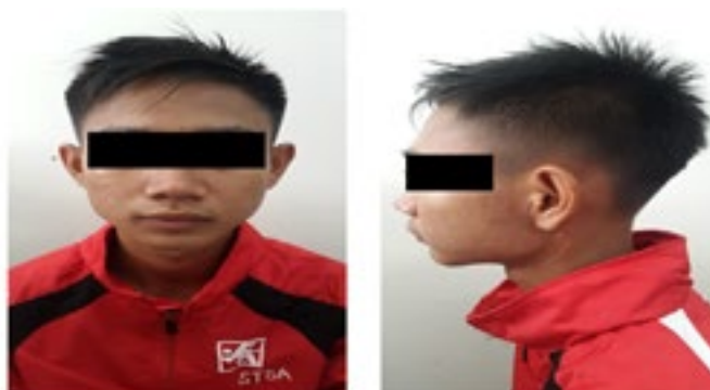
Gambar 5 Gambaran Klinis pasca dilakukan pembedahan dan radioterapi (Kontrol 1 Tahun)