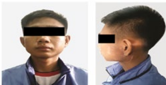
Gambar 4 Gambaran Klinis pasca dilakukan pembedahan dan radioterapi (Kontrol 6 Bulan)

Pasien kemudian dilakukan kontrol selama satu tahun, tanpa terapi farmakologi. Anamnesis, pemeriksaan fisik, dan pemeriksaan penunjang pada bulan ke-6 dan ke-12 menunjukkan tidak didapatkan adanya rekurensi (Gambar 4 dan 5).