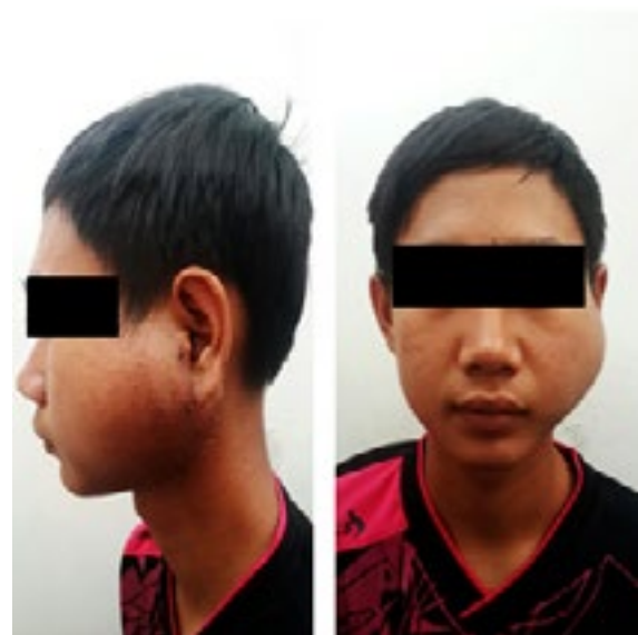
Gambar 1 Gambaran Klinis sebelum pembedahan dan radioterapi

Pemeriksaan biospi jarum halus, menunjukkan hasil karsinoma parotis kemungkinan suatu mukoeipidermoid, untuk kemudian direncanakan parotidektomi total. Pada temuan operasi, didapatkan keterlibatan saraf fasialis dalam massa parotis, sehingga hanya dilakukan parotidektomi superfisial. Pemeriksaan histopatologis pasca operasi menunjukan gambaran folikel eosinofil dengan sentrum germinativum yang tampak nyata dan hiperemis, infiltrasi sel radang eosinofil yang nyata, terbentuknya abses eosinofil ( mikroabses ), hiperemis interfolikuler dan banyak jaringan ikat didalamnya ( reactive follicular hyperplasia ) menunjukan gambaran penyakit kimura.