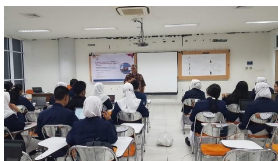
Gambar 2. penyampaian materi Mendeley

Penyampaian materi dalam pelatihan ini dibagi atas dua bagian. Pertama, penyampaian materi motivasi kepenulisan. Penyampaian materi motivasi menulis bermaksud untuk memberikan gambaran awal mengenai perlunya publikasi ilmiah bagi akademisi. Penyampaian materi selanjutnya adalah mengenai pengetahuan awal mengenai aplikasi Mendeley . Penyampaian dilakukan dengan metode ceramah. Secara spesifik, materi yang disampaikan adalah mengenai pengertian, fungsi, kelebihan, cara menginstal, dan cara mengoperasikan Mendeley .