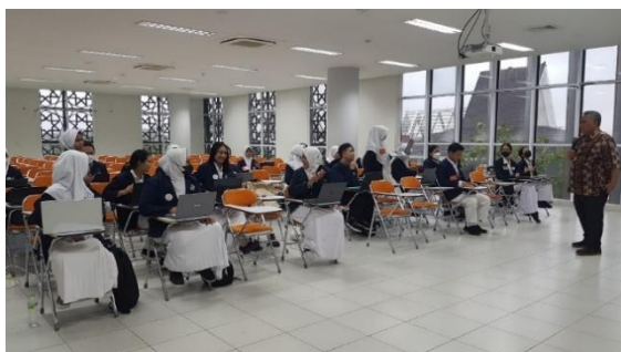
Gambar 3. Tanya Jawab Mahasiswa dan Pemateri