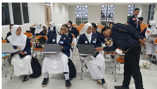
Gambar 4. Bimbingan Secara Berkelompok

Sesi selanjutnya adalah sesi demonstrasi oleh pemateri agar mempermudah peserta untuk lebih memahami langkah-langkah dalam proses instalasi software dan pengoperasian Mendeley . Pada kegiatan ini, peserta diminta untuk langsung mempraktikkan langkah-langkah yang ditunjukkan oleh pemateri. Pemateri dalam sesi ini secara otomatis memetakan kelompok kecil dari peserta pelatihan. Pengelompokan tersebut diharapkan dapat memberikan gambaran kepada materi apakah setiap kelompok kecil terdapat mahasiswa yang mampu menginstal dan mengaplikasikan Mendeley . Pada tahap ini, peserta pelatihan diminta untuk bisa mengoperasikan Mendeley pada portofolio yang mereka bawa baik berupa makalah maupun artikel yang pernah ditulis.