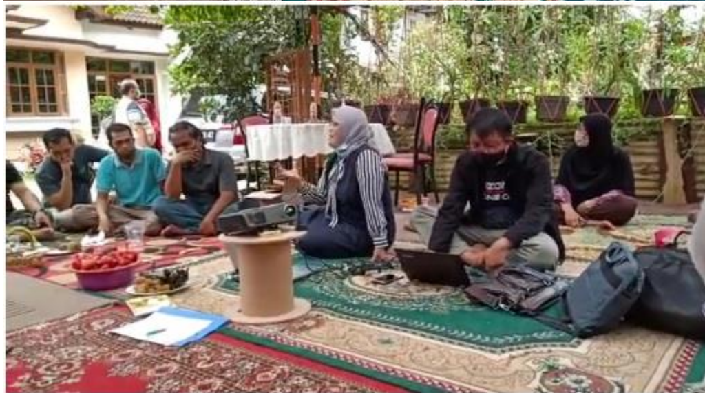
KEGIATAN PKM PEMBERDAYAAN MASYARAKAT LESTARI FARM

DESA GUDANG, KECAMATAN TANJUNGSARI, KABUPATEN SUMEDANG, 3 NOVEMBER 2020