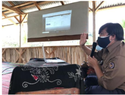
Gambar 1: Instruktur Pelatihan Menjelaskan system pengelolaan website

Dusun Kreatif. Tujuannya adalah sebagai pondasi dasar pengetahuan dan keterampilan yang diharapkan dapat terbentuk pada peserta pelatihan. Selanjutnya setelah classroom activity , peserta pelatihan diajak melakukan pelatihan dasar penggunaan website dan tanya jawab.