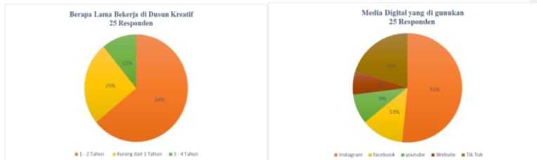
Gambar 2. Karakteristik Peserta Pelatihan