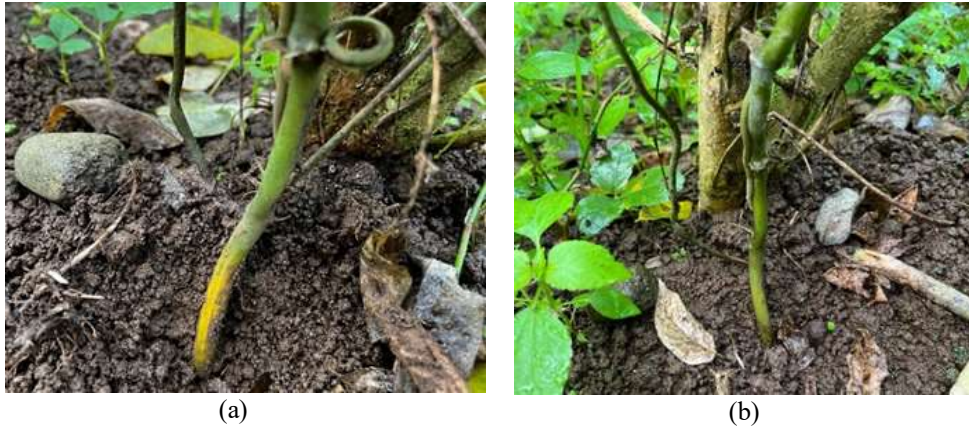
Gambar 3. Gejala penyakit busuk batang vanili pada konsentrasi 7,5 ml (a) Sebelum perlakuan biopestisida Fobio dan (b) setelah perlakuan biopestisida Fobio

batang vanili Choliq et al. (2020) menyatakan bahwa fungsi PGPR sebagai pengendali patogen yaitu dengan menghasilkan berbagai senyawa anti patogen seperti siderophore, kitinase, antibiotik dll. Enzim kitinase dapat merusak dan melisiskan dinding sel penyusun hifa patogen sehingga sel mengalami osmosis dan kemudian mati (Rosyida et al. , 2022).