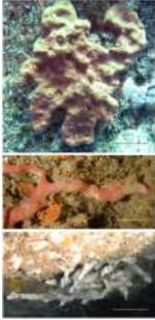
Gambar 2. Spesimen P. ficiformis yang menunjukkan mineral: (A) tipe massif berwarna violet yang hidup di daerah terang (B, C) tipe merayap dengan warna merah muda dan putih masing-masing hidup dalam kondisi cahaya redup dan gelap (Burgsdorf, et al. , 2014).

Spons Petrosia ficiformis dapat ditemukan di seluruh bagian Laut Mediterania dan Samudra Atlantik Timur. P. ficiformis biasanya dideskripsikan dengan dua morf yang berbeda (Sarà, et al. , 1998): (i) bentuk masif, berpigmen violet, hidup di habitat yang diterangi yang menyimpan populasi aden cyanobacteria intraseluler di korteks spons (lapisan superfisial dari spons); dan (ii) morf merah muda atau