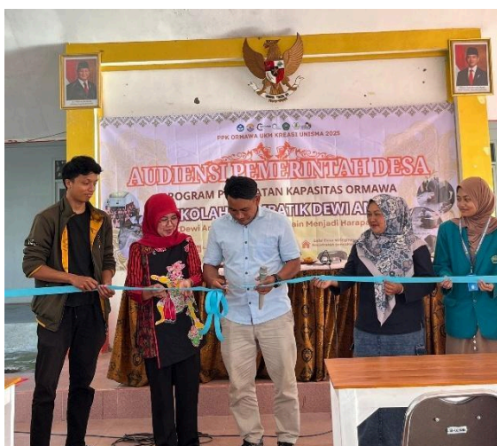
Gambar 3. Audiensi Pemerintah Desa Wringinanom

Kegiatan ini diakhiri dengan peluncuran resmi Komunitas Rancang Perempuan, yang diresmikan oleh Kepala Desa melalui penandatanganan nota kesepahaman dan penyerahan kurikulum Sekolah Batik sebagai sarana keberlanjutan program.