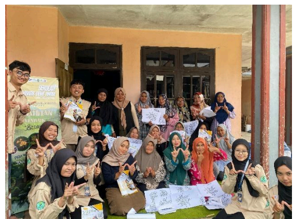
Gambar 1. Peserta Sekolah Membatik Dewi Anom

Program ini diikuti oleh 18 peserta, terdiri dari 16 anggota Pemberdayaan Kesejahteraan Keluarga (PKK) dan 2 anggota organisasi pemuda perempuan. Sebagian besar peserta PKK adalah ibu rumah tangga dan petani, sementara anggota pemuda adalah mahasiswa aktif. Komposisi ini mencerminkan keterlibatan antar generasi yang mendukung keberlanjutan program melalui transfer pengetahuan.