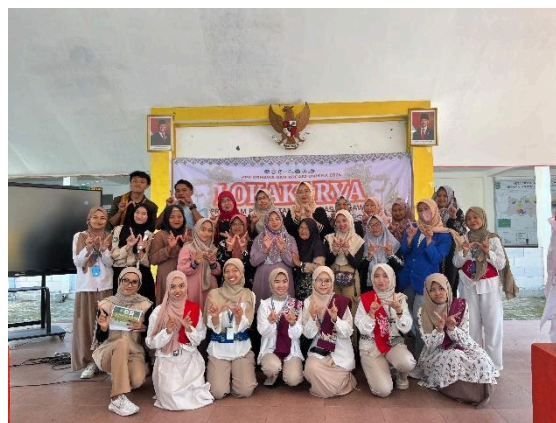
Gambar 2. Focus Group Discussion di Balai Desa Wringinanom

FGD bertujuan untuk mengevaluasi pelaksanaan program serta merumuskan strategi pengembangan Desa Wisata Batik Wringinanom secara partisipatif. Diskusi menghasilkan beberapa rekomendasi penting, antara lain kebutuhan pelatihan lanjutan pada aspek pemasaran, perluasan jaringan bisnis, penguatan fasilitas produksi, dan penguatan kelembagaan kelompok perempuan sebagai langkah tindak lanjut peningkatan kapasitas ekonomi peserta. Ringkasan temuan dan rekomendasi hasil FGD disajikan pada tabel 1.