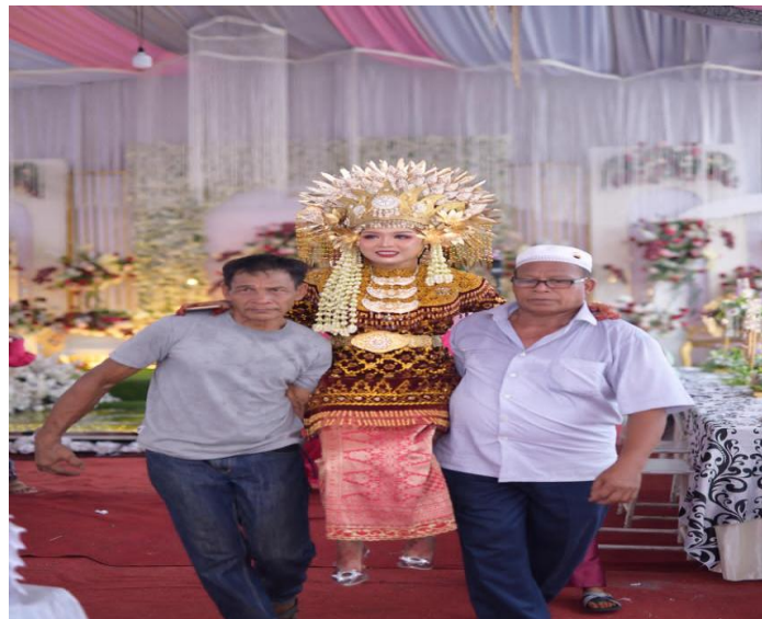
Gambar 2: Busana Adat Pengantin Perempuan

Simbol lain yang muncul adalah pakaian adat Jambi yang dikenakan pengantin. Baju kurung tanggung dengan sulaman emas, mahkota, dan aksesoris lain melambangkan kemuliaan, tanggung jawab, dan legitimasi sosial. Berdasarkan wawancara dengan masyarakat, pakaian ini dipandang sebagai simbol status serta kesucian pengantin. Dokumentasi visual pada Gambar 2 menegaskan detail busana adat yang sarat dengan simbolisme. Hal ini sejalan dengan penelitian (Firliyana 2023; Kamila dkk. 2024) yang menemukan bahwa busana adat dalam pernikahan berfungsi memperkuat identitas kultural sekaligus sebagai penanda status sosial.