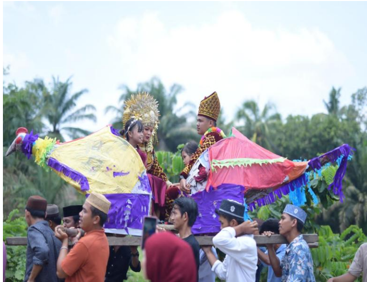
Gambar 1: Prosesi Arak-Arakan

Fenomena ini memperlihatkan bahwa pernikahan adat bukan sekadar penyatuan dua individu, tetapi sebuah ritual sosial yang meneguhkan nilai budaya, status sosial, dan identitas kolektif masyarakat. Dokumentasi visual yang ditunjukkan pada Gambar 1 memperlihatkan bentuk replika garuda yang dipikul dalam prosesi, menjadi simbol sentral dari upacara adat tersebut.