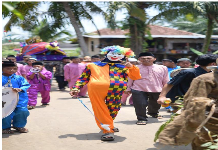
Gambar 4: Hadirnya Badut dalam Perayaan Tradisi Pernikahan Adat Naik Garudo