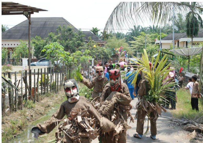
Gambar 3: Penggunaan Topeng Mersam di Acara Arak-Arakan

Prosesi Naik Garudo tidak hanya menampilkan simbol-simbol adat, tetapi juga menjadi arena interaksi sosial yang melibatkan berbagai aktor dalam masyarakat Mersam. Berdasarkan hasil observasi dan wawancara, terlihat bahwa pemangku adat, keluarga pengantin, tetua masyarakat, hingga warga biasa turut serta dalam prosesi ini. Berdasarkan hasil wawancara, keterlibatan ini tidak bersifat spontan, melainkan diatur melalui komunikasi informal antarwarga beberapa hari sebelum acara. Misalnya, pembagian peran seperti pembawa garuda atau pengiring musik ditentukan melalui kesepakatan kolektif. Keterlibatan yang luas menjadikan pernikahan adat bukan hanya urusan pribadi, melainkan peristiwa kolektif yang melibatkan komunitas secara menyeluruh. Dokumentasi pada Gambar 3 yang memperlihatkan suasana arak-arakan garuda juga dikelilingi oleh masyarakat yang menggunakan topeng Mersam, mendukung temuan bahwa prosesi ini menegaskan dimensi sosial yang kuat.