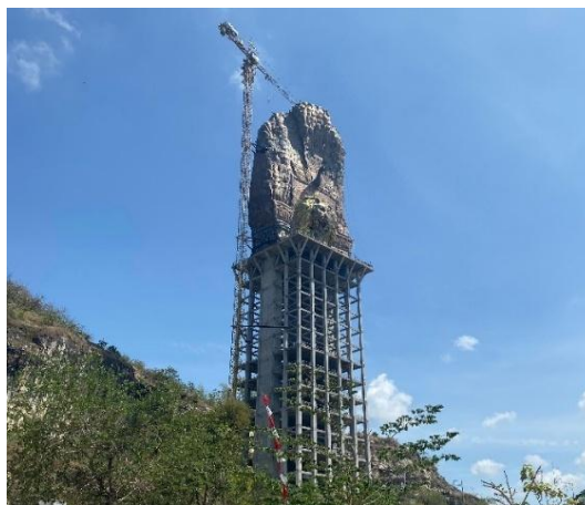
Gambar 4 Monumen Reog dan Museum Peradaban saat ini

Untuk saat ini Proyek Pembangunan Monumen Reog dan Museum Peradaban masih baru selesai tahap pertama. Tahap pertama yaitu memuat pembangunan gedung utama, museum, dan patung Reog. Sekitar monumen seperti mushola, auditorium plaza, lobby, parkir, dan sebagainya masih belum dimulai pembangunannya.