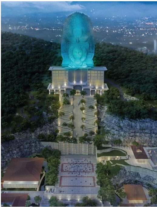
Gambar 2 Desain Monumen Reog dan Museum Peradaban